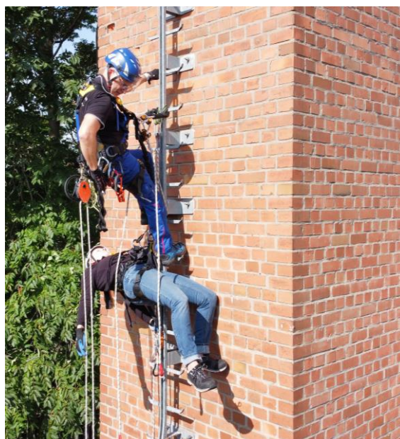
Abbildung 3 und 4 – Einblicke: Workshop zum Einsteigen in Behälter und Rettung aus Steigleitern.