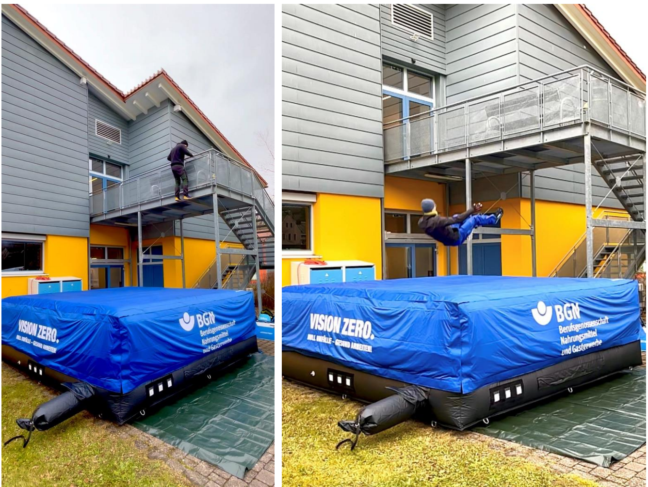
Abbildung 5 und 6 – Absturz in das Fallschutzkissen