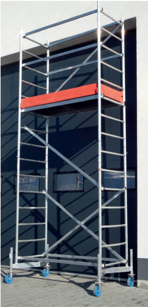
Fahrgerüste bestehen aus vorgefertigten Teilen, die bei Bedarf schnell zusammengebaut werden können.

Zum Dekorieren von Festzelten und Veranstaltungsräumen oder bei Haus- technicarbeiten wird oft ein Fahrgerüst eingesetzt. Falsch verwendet kann es leicht umkippen – mit schweren Unfallfolgen für das Personal. Um Unfälle zu verhindern, muss man einiges beachten. Das beginnt schon beim Kauf eines Fahrgerüsts. Denn nur, wenn das Fahrgerüst für den Einsatzzweck passt, kann es auch sicher verwendet werden.