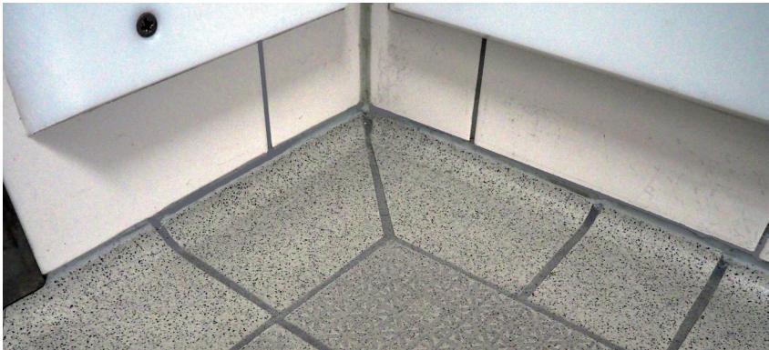
Abb. 6: Vorbildlicher Bodenbelag im Eckbereich

Um das Reinigen unter z. B. Kochkesseln etc. zu erleichtern, ist es sinnvoll, diese auf Sockel zu stellen oder sie an der Wand zu befestigen. Es ist ratsam, unter diesen fest stehenden Maschinen und Geräten Böden mit möglichst geringen R-Werten bzw. ohne Verdrängungsraum zu verlegen. Eine besonders elegante Variante für die Aufstellung von Maschinen und Geräten wurde bereits in Abbildung 3 gezeigt.