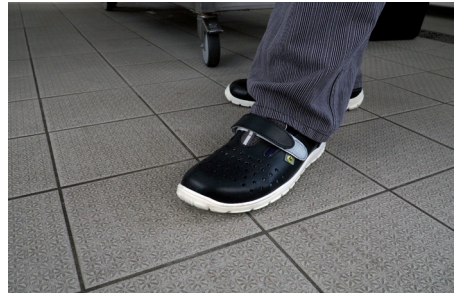
Abb. 16: Geeignetes Schuhwerk auf rutschhemmendem Fußboden mit Verdrängungsraum

Der Fußboden ist regelmäßig auf erkennbare Schäden zu prüfen. Verschlissene