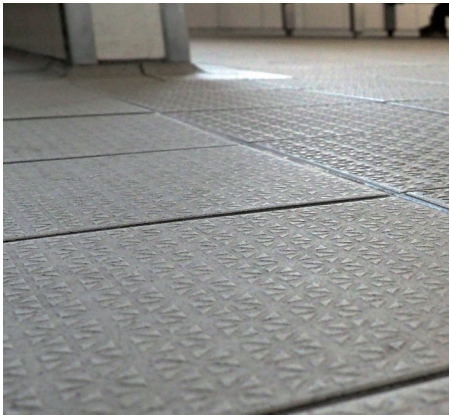
Abb. 1: Übergang zweier Bereiche mit ähnlicher Rutschhemmung bzw. ähnlichem Verdrängungsraum

Das Institut für Arbeitsschutz der DGUV (IFA) publiziert eine „ geprüfte Bodenbeläge-Positivliste “. In dieser Positivliste sind geprüfte und in eine der Bewertungsgruppen der Rutschhemmung und gegebenenfalls des Verdrängungsraumes eingeordnete Bodenbeläge aufgeführt. Darüber hinaus erteilen die Hersteller Auskünfte über die Zuordnung ihrer Bodenbeläge zu den einzelnen Bewertungsgruppen.