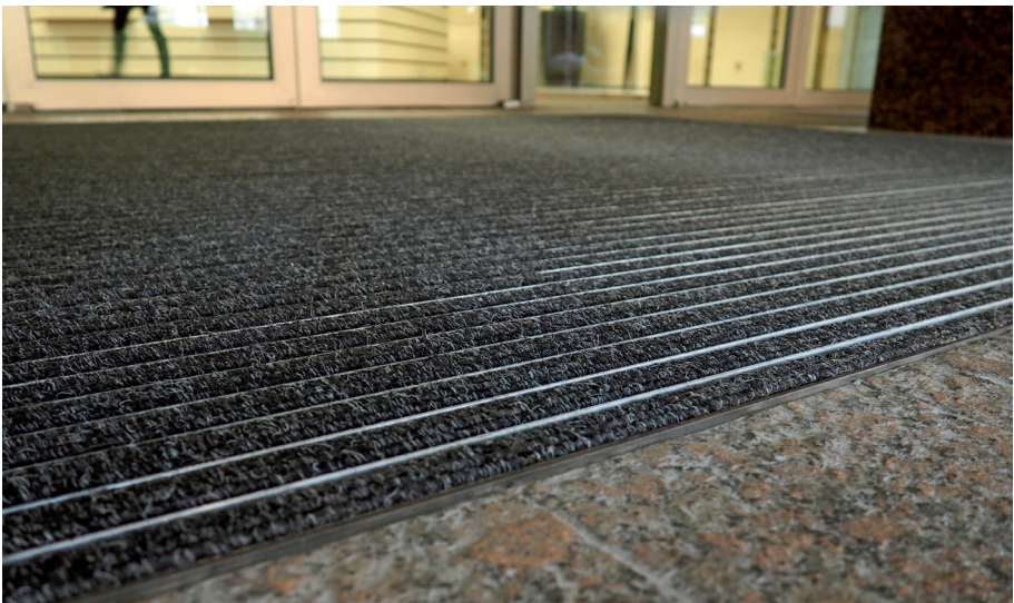
Abb. 7: Großflächig und eben verlegte Schmutzschleuse im Eingangsbereich eines Gebäudes

Bei der Auswahl einer wirkungsvollen „Schmutzschleuse“ sollte beachtet werden, dass diese so gestaltet und angebracht ist, dass man nicht einfach daran vorbeigehen kann und eine gewisse Anzahl an Schritte in Laufrichtung darauf zurücklegen muss. Schmutz- und Feuchtigkeitsaufnehmer sind so anzubringen, dass sie nicht verrutschen können und keine Stolperstellen bilden (Abb. 7).