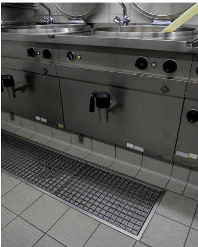
Abb. 3: Auslauföffnung ist direkt unter den Ausläufen angebracht

Fußböden bzw. Bodenbeläge dürfen keine Stolperstellen aufweisen.