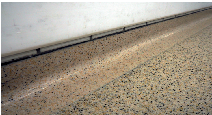
Abb. 11: Kunstharzboden, an der Wand rund ausgeführt

Die rasche Verlegung und frühe Begehbarkeit ist einer der Vorteile solcher Böden. Die geringen Schichtdicken (2 bis 15 Millimeter) sind ein weiterer Vorteil gegenüber anderen Lösungen. Ähnlich der Hohlkehlfiese kann der Kunstharzestrich an den Wänden hochgezogen sowie ausgerundet gestaltet werden (Abb. 11).