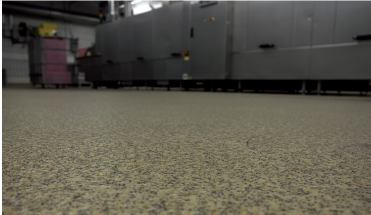
Abb. 10: Kunstharzboden mit Zuschlagstoffen

Die Rutschhemmung wird durch Zuschlagstoffe erzielt (Abb. 10).