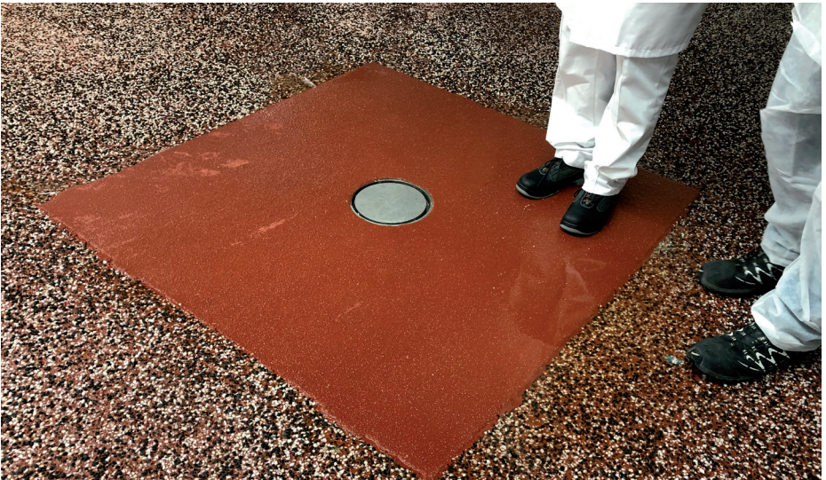
Abb. 9: Schadhafter Fußboden, mit Kunstharz repariert

eignen, andererseits sind sie auch gut flächendeckend auf Estrich bzw. Beton aufzubringen.