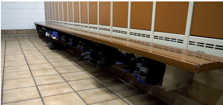
Abb. 14: Nassbelasteter Fußboden im Bereich einer Umkleide

Auch Bodenbeläge für Barfußbereiche sind je nach Einsatzbereich Bewertungsgruppen (hier A, B und C) zugeordnet (Tabelle 4).