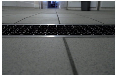
Abb. 4: Eben verbaute Auslauföffnung mit profilierter Gitterabdeckung

Um Stolperstellen zu vermeiden sind Abdeckungen eben mit dem angrenzenden Fußboden zu verlegen. Auch die Oberflächen von Abdeckungen müssen rutschhemmend gestaltet sein.