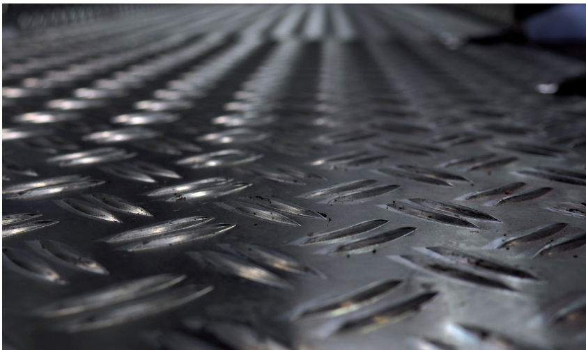
Abb. 12: Industrieboden aus Edelstahl mit „Tränenblech-Profilierung“

Wird eine große Anzahl von Rosten (z. B. auf Bühnen) verlegt, empfiehlt es sich, einen Verlegeplan vom Hersteller bzw. der verlegenden Fachfirma ausarbeiten zu lassen. Ausschnitte an Gitterrosten und oftmals auch an Profilrosten müssen eingefasst werden.