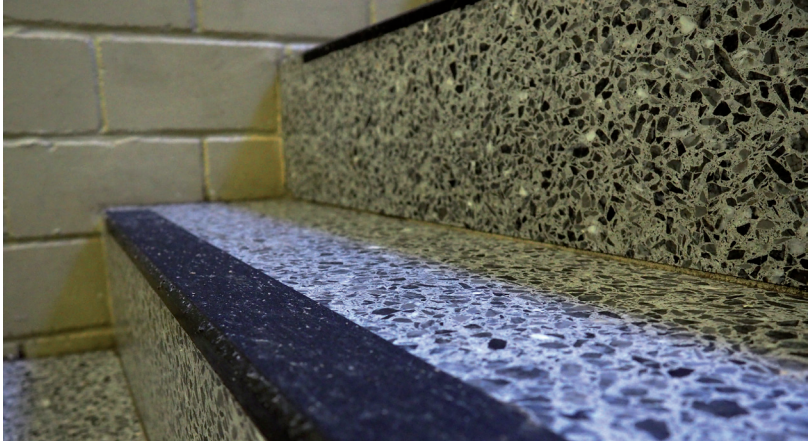
Abb. 15: Selbstklebender Belag auf Treppenstufe