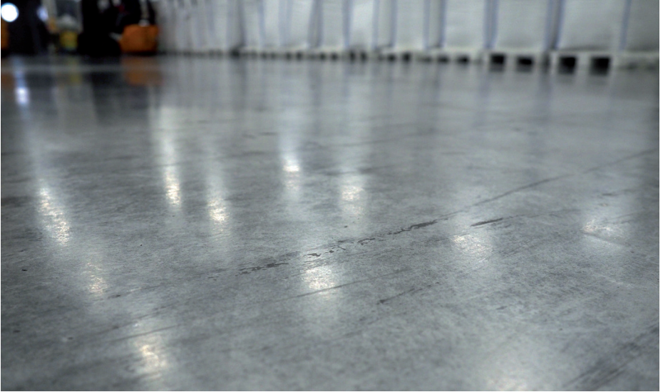
Abb. 8: Industriefußboden aus Beton im Bereich eines Lagers

Kunsthazestriche und Kunststoffvergussböden sind einerseits Beläge, die sich zum Erneuern schadhafter Böden (Abb. 9)