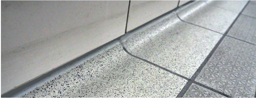
Abb. 5: Bodenbelag im Übergangsbereich zur Wand mit rund ausgeformten, unprofilierten Kehlsockel und angrenzenden profilierten Fliesen