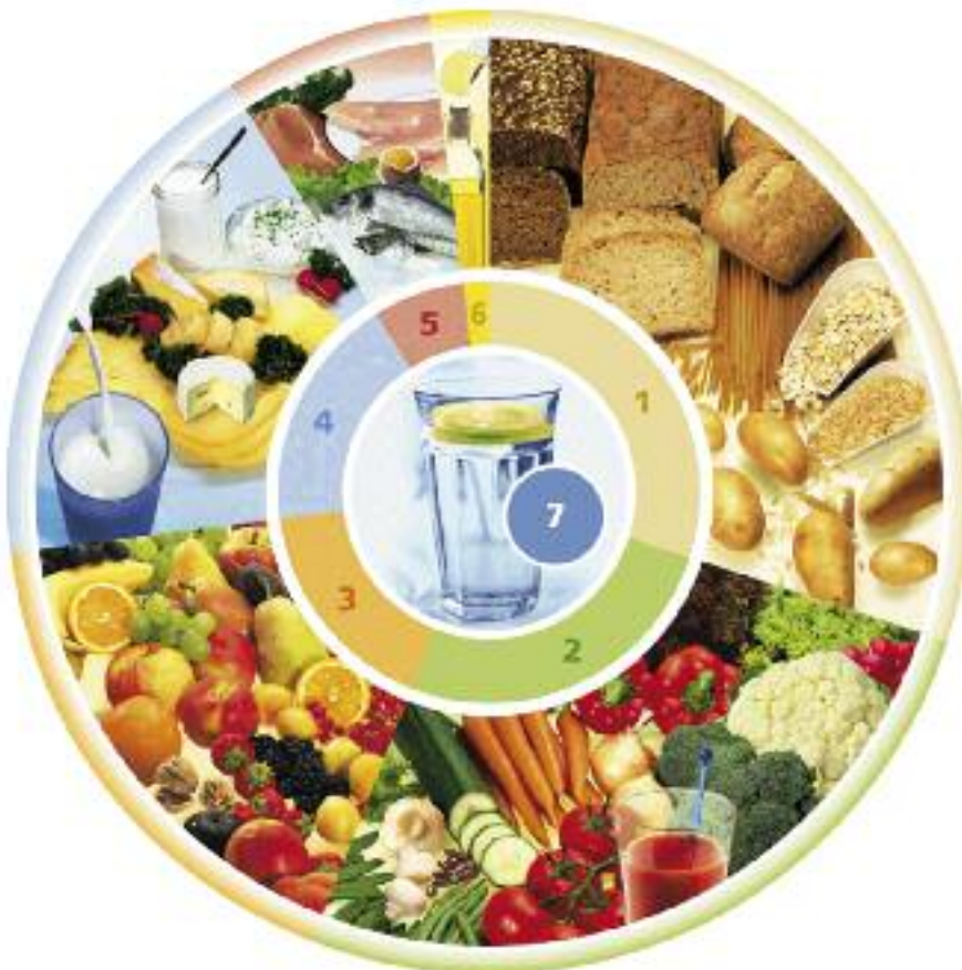
Der Gesund essen – Teller